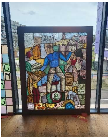
Afbeelding 3: Glas-in-lood raam van de Almelose kunstenaar Berry Brugman.