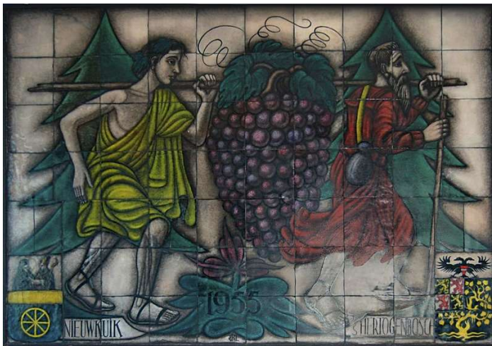
Afbeelding 2: Opalinepaneel 'In 't Land van Belofte' van glazenier Rien van der Pol.