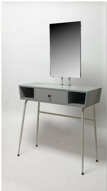
Afbeelding 1: Inv.nr. 511. Toilettafel nr. 670 'Louise'. Ontworpen door Willem Gilles voor de fabriek Rademaker Winschoten (RAWI).

Praat hierover mee tijdens de waardering van dit ensemble op woensdag 15 mei om 14.00 uur.